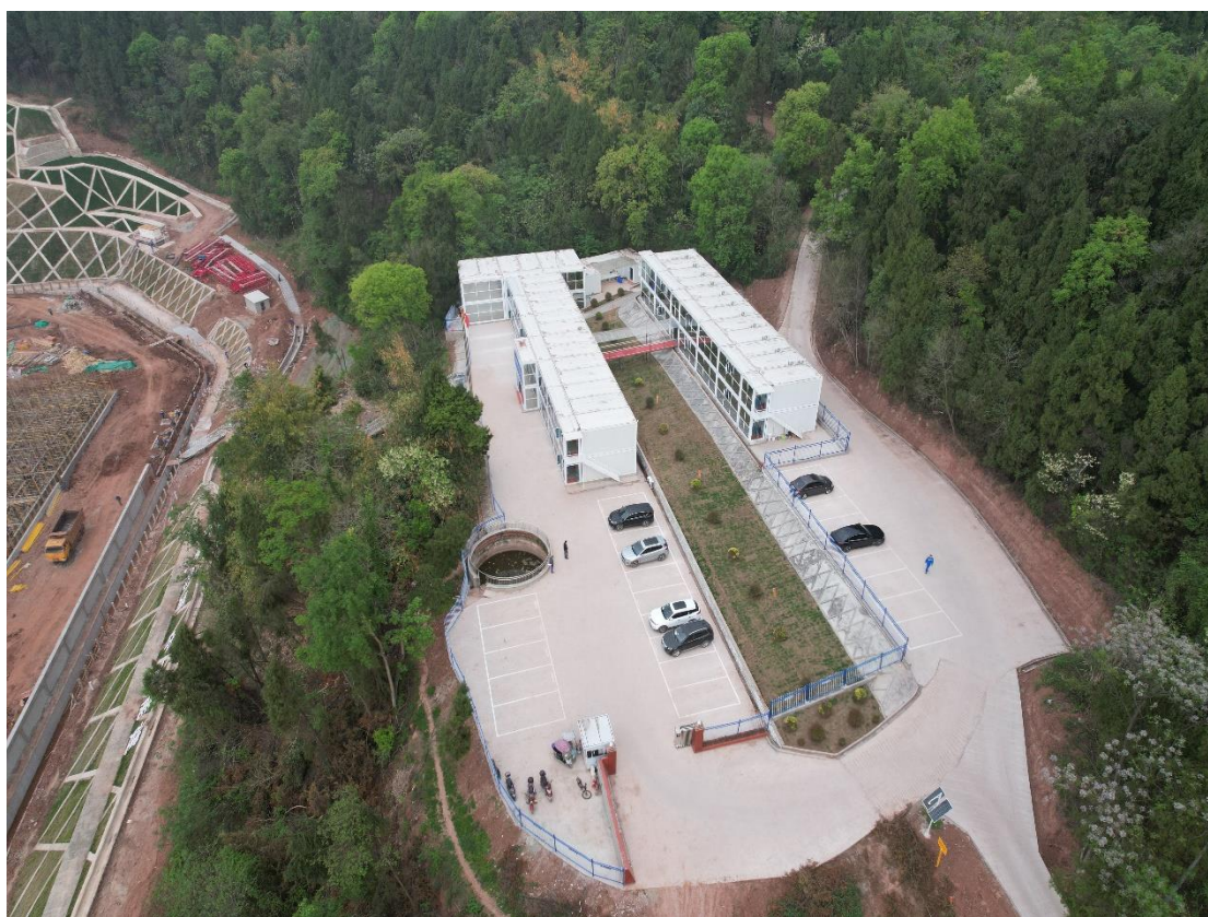
图2-1 现场施工营地及施工项目部(工程部)

承包方(中国电力工程顾问集团西南电力设计院有限公司作为牵头方与中国能源建设集团广东火电工程有限公司组成联合体)租用当地民房(位于资阳市安岳县永顺镇玉康村)设立了施工项目部以及施工营地,颁布了施工管理文件,提交了施工组织设计,施工管理人员全部到位,施工人员基本到位,并在各重要标段增投施工人员,保证本月施工进度稳步向前推进。