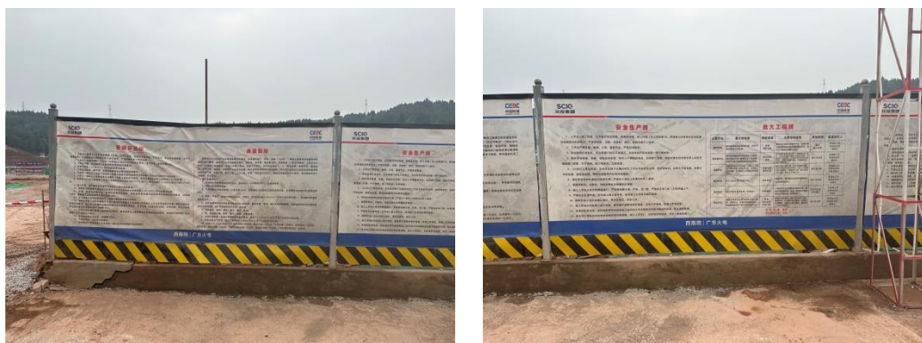
图7-1 安全文明施工标志牌、标语

施工单位本月做到了安全生产与文明施工，未发生安全生产事故。施工期间严控扰动范围，人员、机械未对征占地外造成扰动。