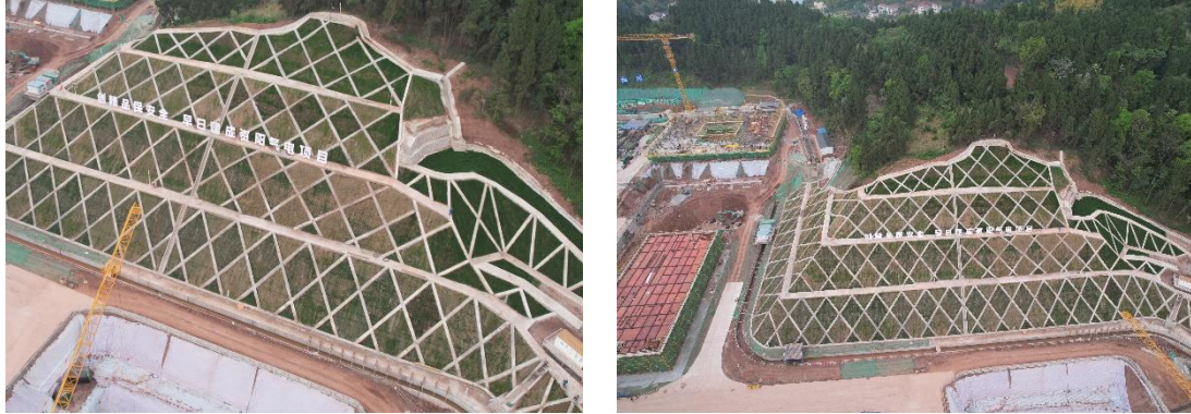
图1-7 边坡浆砌石护坡实施情况