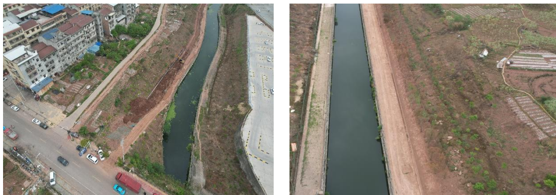
图1-10 取水管线工程区现状

截止本月（2023年5月），取水管线工程区管线沟槽已开挖完成，大部分区域已进行了回填，部分区域正在进行管线埋设，对临时堆土区域采取了临时覆盖措施，采取了栽植乔木恢复植被，但部分扰动区域植被恢复措施实施不及时。（详见图1-10）。