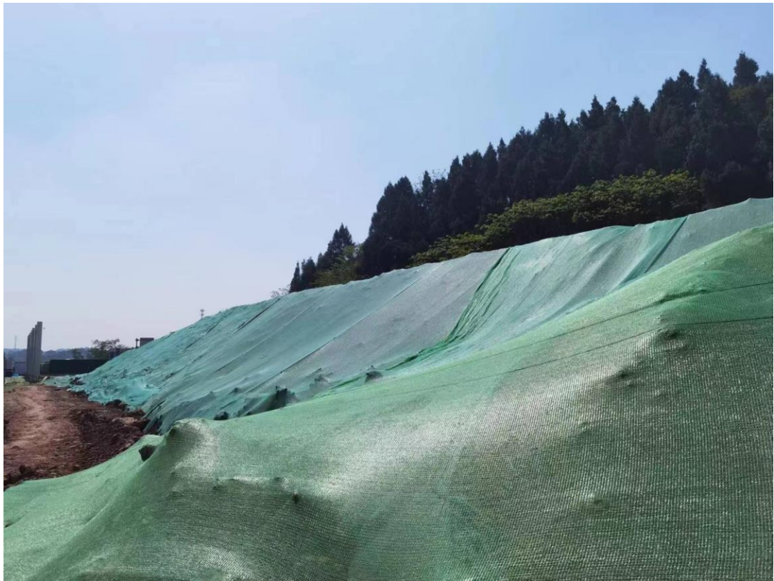
图1-12 表土临时堆放场区现状