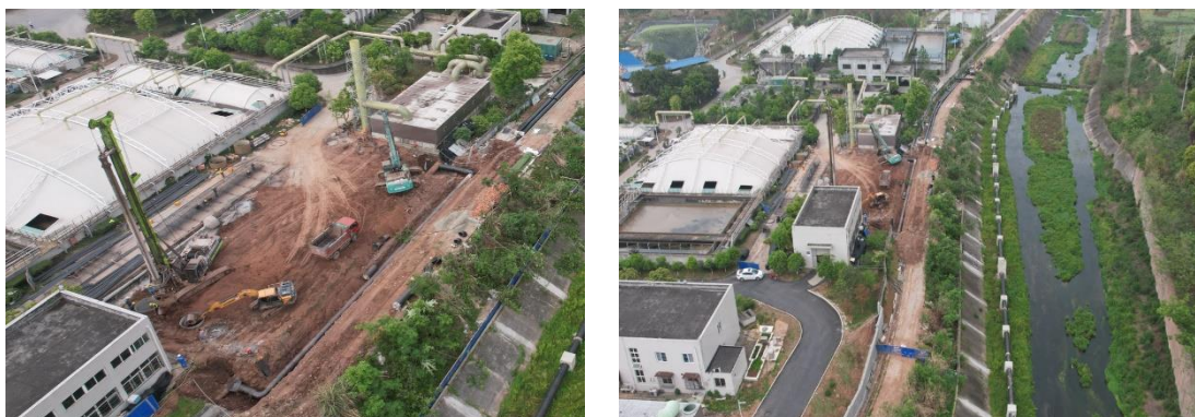
图1-9 取水泵房扰动现状

截止本月（2023年5月），本项目取水泵房区正在进行基础开挖，并对开挖的土石方进行集中堆放，施工过程中严格控制了扰动范围，实施的各项水土保持措施防治水土流失效果明显（详见图1-9）。